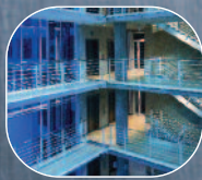
BUDOWNICTWO I ARCHITEKTURA