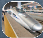
TRANSPORT I MOTORYZACJA